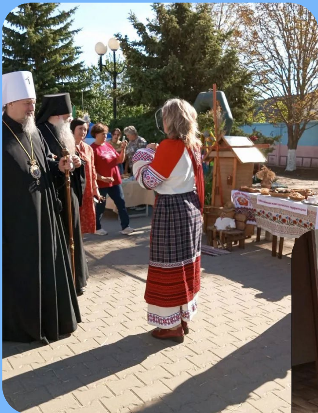
Фестиваль сена «На Тихой Сосне»